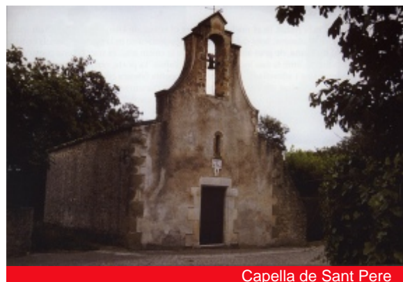
Capella de Sant Pere

Altres cases remarcables de Sobrànigues són can Casamor , a la Plaça Vella, amb porta i finestres amb impostes i espitlleres de defensa a la façana, i can Ribes , al carrer de l'Oli, una casa de gran antiguitat, amb reformes del segle XVIII, on destaca la decoració de la llinda de la finestra principal, en la qual es pot veure una curiosa figura humana en relleu al costat d'un motiu circular radiat d'interpretació difícil.