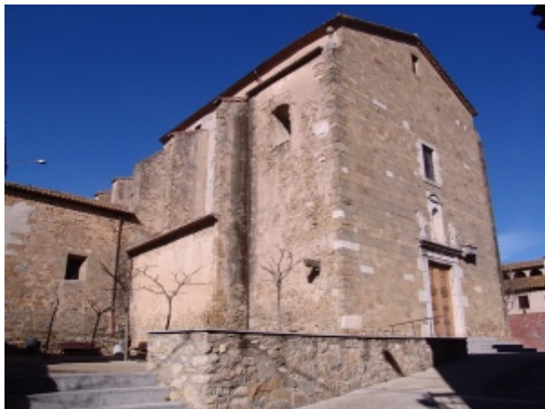
Església de Sant Jordi Desvalls

Del poble de Sant Jordi hem de destacar sobretot el seu nucli antic, presidit per l'església de Sant Jordi i les restes del castell, que ha conservat quasi intacte l'entramat dels carrers medievals i un bon nombre de cases que preserven la fesomia que tenien segles enrera, amb portals adovellats, llindes decorades i inscrites, o finestres d'estil gòtic i renaixentista.