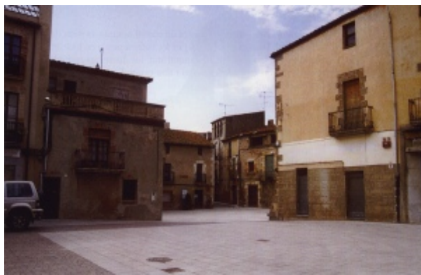
Plaça de la Constitució