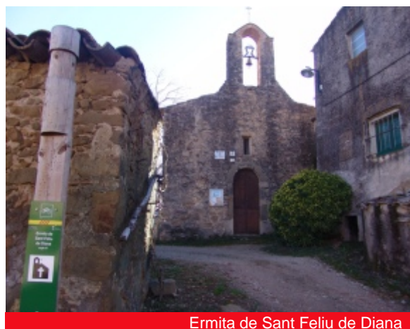
Ermita de Sant Feliu de Diana

Encara més reduït és el nucli que centra el veïnat de Diana, al nord de Sant Jordi, camí de Viladesens. Sens dubte, l'edifici més destacable és la petita església de Sant Feliu de Diana, de gran antiguitat. Tal com la veiem avui, es tracta d'una construcció del segle XI, amb la nau indiferenciada de l'absis. La porta, oberta a ponent, és d'arc de mig punt i adovellada, i a sobre té una petita finestra rectangular i un campanar d'espadanya d'un ull, construït en una època clarament posterior. Ja hem vist com d'aquesta petita església procedeix un possible cancell d'altar datat al segle X, que revela l'existència d'un edifici encara més antic que al segle XI fou substituït per l'actual.