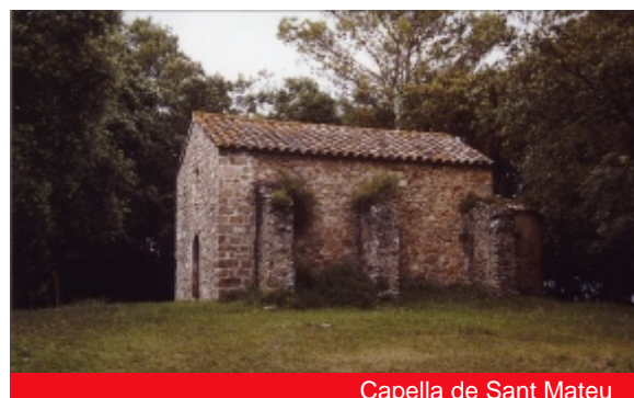
Capella de Sant Mateu

Si continuem cap al nord, després de travessar el torrent de Sant Mateu, arribarem al veïnat del mateix nom, format per un seguit de masies escampades i centrat per la capella de Sant Mateu, al capdamunt d'un petit turó emboscat. Restaurada fa pocs anys, es troba documentada al segle XIV, però la construcció sembla tenir orígens romànics. És d'una nau rectangular i absis semicircular, i exteriorment està reforçada amb un seguit de contraforts, mentre que la façana principal mostra una porta d'arc de mig punt adovellada i una finestra també d'arc de mig punt. Durant les restauracions s'hi va trobar una lipsanoteca (una caixeta on s'hi solien guardar documents, relíquies i altres objectes relacionats amb el culte de la capella) de fusta.