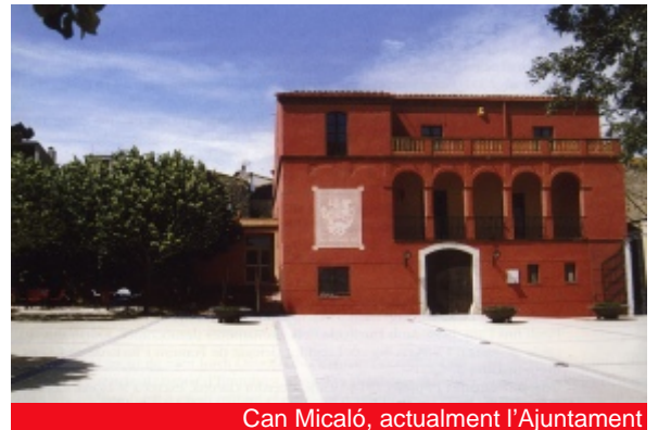
Can Micaló, actualment l'Ajuntament

A tocar de la carretera és ben visible el notable edifici de les Escoles Municipals, projectat per l'arquitecte Emili Blanch i inaugurat l'any 1934. Concebut inicialment sota les formes noucentistes, es retocà el projecte per incloure-hi les influències del nou corrent racionalista, de gran difusió als anys 30. Destaca el cos central, on hi ha l'entrada principal, una sala de sessions i els despatxos administratius que es troba avançat respecte als dos pavellons laterals, i està decorat amb una cornisa esglaonada i un frontó truncat. Els pavellons, on hi ha les aules, tenen tots dos una porxada d'arcs de mig punt sostinguts amb columnes jòniques i un terrat amb balustrada al capdamunt. Davant de les escoles, a l'altra banda de la carretera a l'inici del camí del Veïnat Nou, hi ha una creu de terme de braços floronsats.